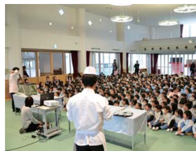
たくさんの幼児の前に:S幼稚園

この度、柏市近郊の飲食業に関わる仲間と、未来に本物の味を伝えることを目的としたプロジェクト「食べてスマイルプロジェクト」をスタートさせました。日本は世界でも有数の経済大国、