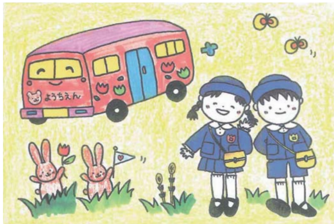
イラスト 中村 宏美