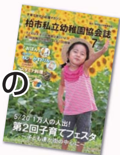
※写真は昨年の幼稚園協会誌7月号