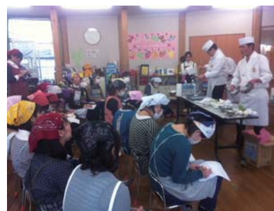
母親を対象に:K②幼稚園