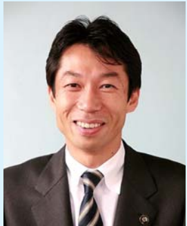
市長 秋山 浩保

保護者連絡協議会と共に、教育費用の負担減を目指す運動や子育て世代を応援する行事も