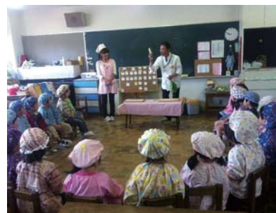
幼児小グループで:K①幼稚園