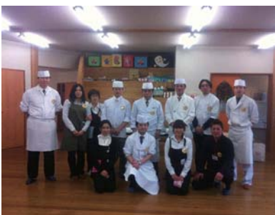
スマイルメンバー (柏及び近郊で飲食業に関わる仲間です)