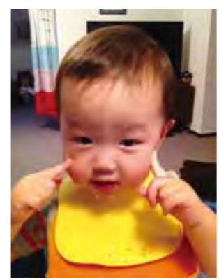
参考文献 食と味覚・建帛社刊 (第2部山本隆執筆)

「繰り返し食べてみないと美味しく感じられない食物がある。そこで度出した料理を子どもが食べないから嫌いなのだと決めつけない方がよいだろう。いやなら食べなくてもいいと突き放してしまえば、子どもは、味を覚えるチャンスのひとつ失うことになる。」