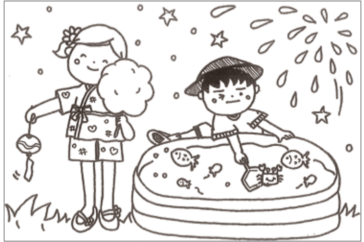
イラスト 中村 宏美