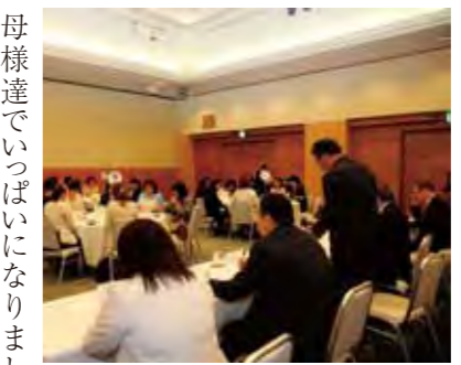
総会で事業を決定

五月三十一日、今年度の保護者連絡協議会が開かれ、保護者連が開かれ、事業や役員を決定しました。保護者連は各幼稚園の保護者代表などからなり、幼稚園協会と共に、子ども達の教育環境の整備や保護者の学びの場づくりをしています。同日の市長訪問は、例年より多数が出席。市長応接室は、お