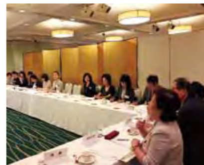
理事長・園長等と意見交換する養成校の諸先生