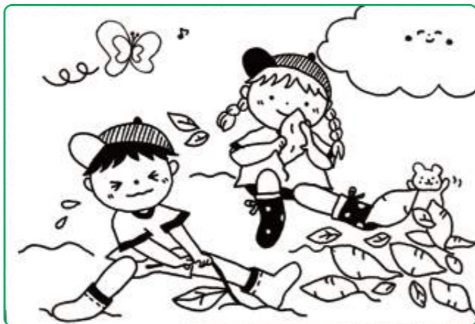
イラスト 中村 宏美