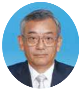
柏市教育委員会教育長 河原 健

柏市教育委員会では、「幼保小連携の推進」を「幼児教育研究の充実」を幼児教育の重点施策として取り組んでおります。