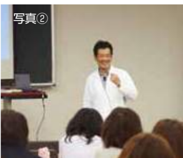
「虫」に親しみをこめて説明する講師

長が内閣府子ども・子育て会議専門委員としての立場から、新制度のねらいと幼稚園職員としての制度との向き合い方を講演しました。