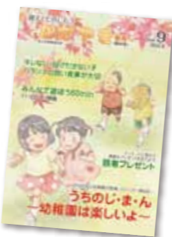
※写真は過去の幼稚園協会誌の表紙です。