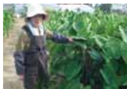
小川ファームのおかあさん