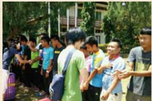
握手後に手を胸に(右から2人目)

の触れ合いを作ります。他者との交流を楽しみ人間関係を学びそして自然とも触れ合えるのですから得るものが大きいのです。年に一度は、親戚や友人の家庭と合同のアウトドア行事をもつては如何でしょうか。大人はビール片手に、子どもは焼いたソーセージ片手に降るような星空を眺めて感動の声をあげる。楽しいこと請け合いです。