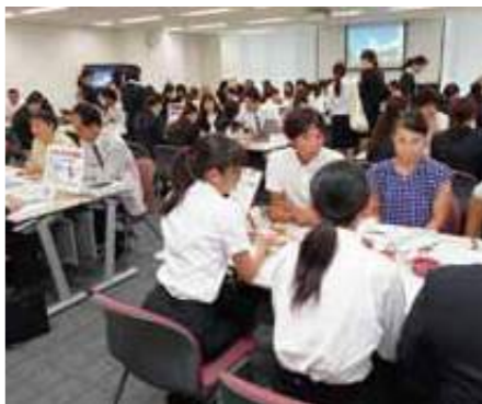
各園のブースは学生などで賑わいました